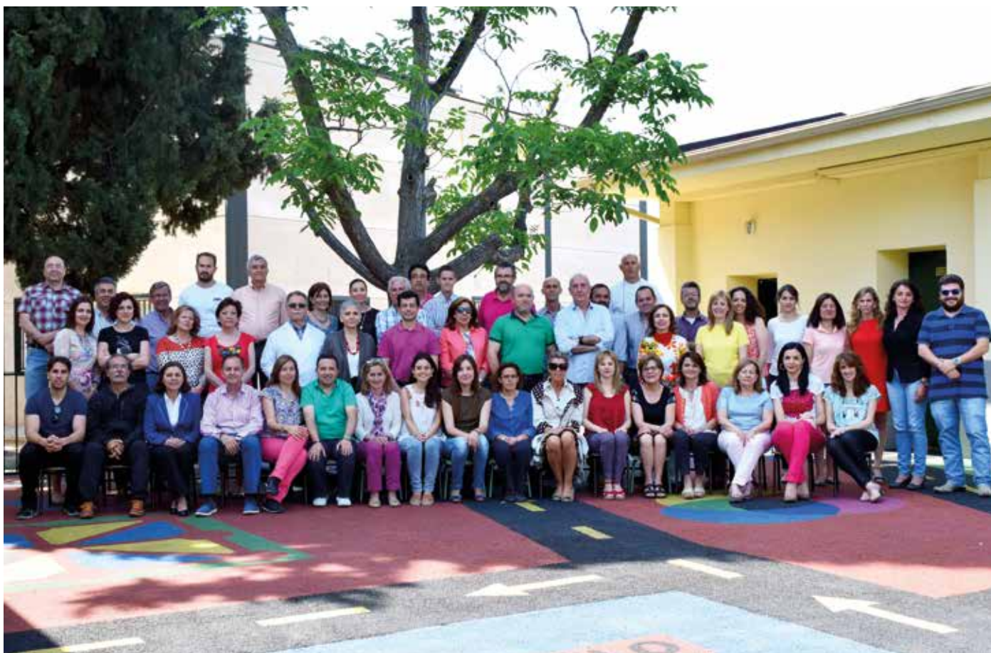
Personal no docente