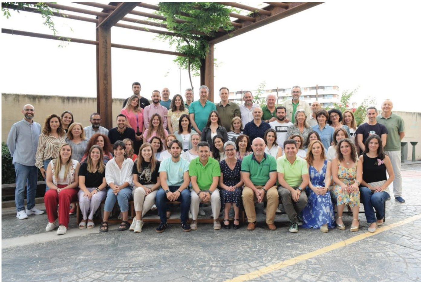
Personal no docente